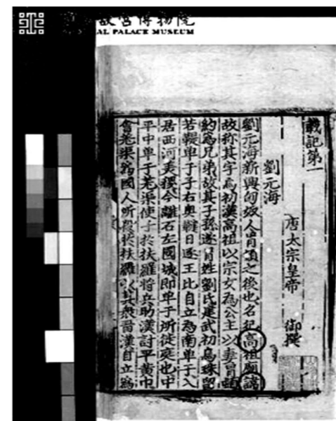
圖一：宋刊元至明正德六年遞修本《晉書載記》 24

.....字樣書的出現和流行使俗字減少，但“通體”“正體”字樣可以隨意使用，文字異體便同時並行。因此，不論是以楷書字體雕板的書刊，或是手鈔本古籍，異體字仍常見，同一文字由筆畫數目到部件外形，都常有不同。 23 台灣國立故宮博物院數位典藏國家型科技計畫所載的宋版元刊本書籍便有同一文字，字樣並不統一的例子，由圖一及圖二所見，“高”可作“高”也可作“高”、“諱”可作“諱”同時又可作“諱”。